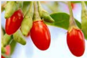
Baies de goji